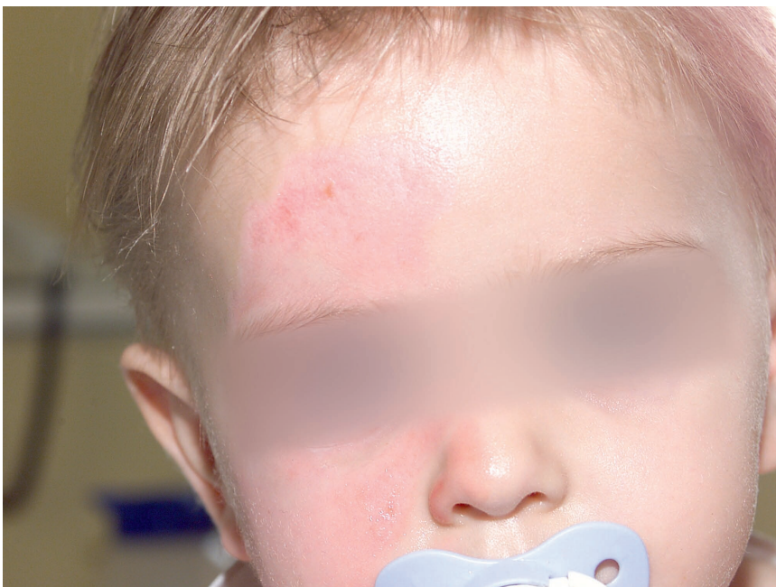
Abb. 4: Verbrühung Grad I Stirn

Die Spalthaut wird gemesht, um die Oberfläche zu vergrößern. Bevorzugte Entnahmestelle bei Kindern ist die behaarte Kopfhaut. Hier können pro Sitzung 300 - 350 cm 2 Spalthaut gewonnen werden. Nach zehn Tagen ist eine zweite Entnahme möglich (5; 6). Andere mögliche Entnahmestellen sind Rücken, Ober- und Unterschenkel, Gesäß. Entnahmetiefe: 0,1 mm. Zweitgradige Areale mit besonderen Lokalisationen an Händen, Füßen und im Gesicht rechtfertigen ein eher abwartendes Verhalten, wobei spätestens am 12. – 14. Tag eine Epithelialisierung erreicht sein sollte. Die Vorteile der Spalthauttransplantation bestehen in nicht sichtbaren Narben und einer rascheren, unkomplizierten Abheilung. Zudem ist sie ein schmerzarmes Verfahren.