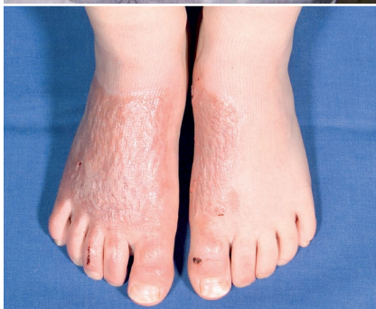
Abb. 9 und 10 Spalthauttransplantation Füße