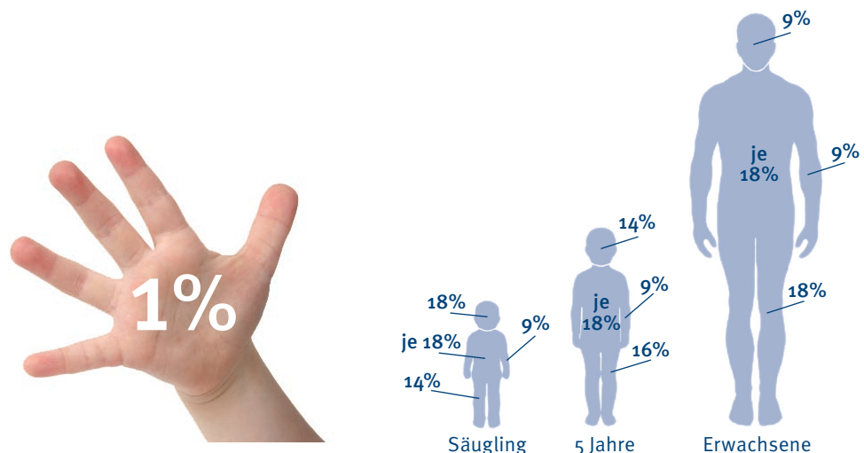
Abb. 2: Handflächenregel, altersangepaßtes Schema und Neunerregel