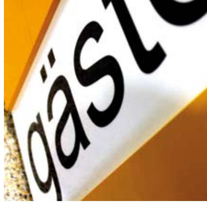
Anschrift Gästehaus adress guest house

We wish you a pleasant journey and are looking forward to meeting you.