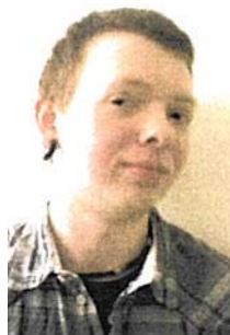
Ole Denecke Stroke Unit