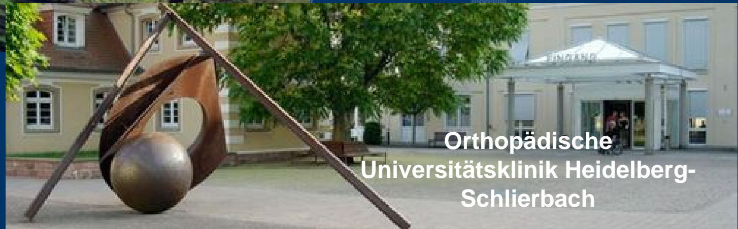
Orthopädische Universitätsklinik Heidelberg- Schlierbach