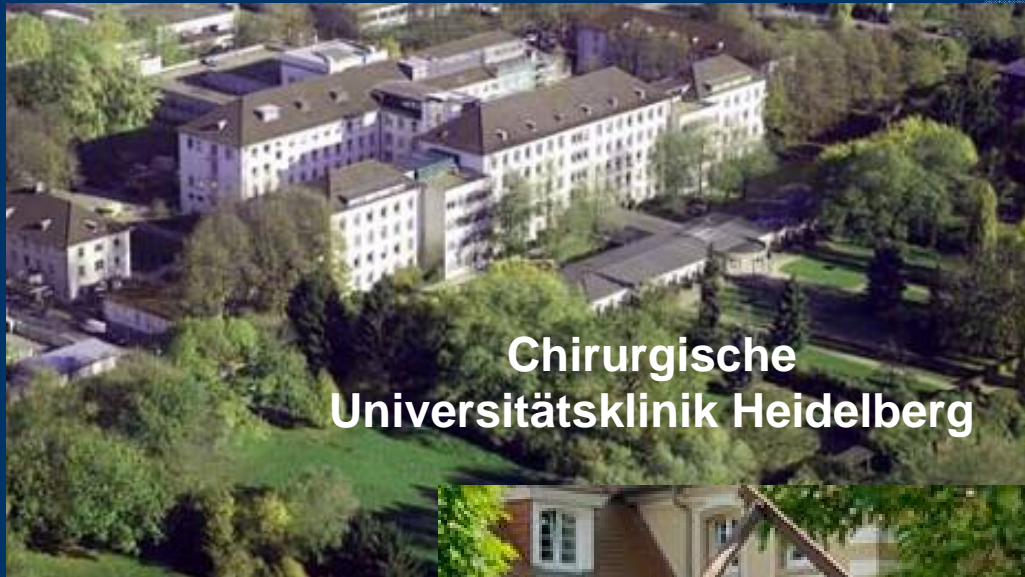
Chirurgische Universitätsklinik Heidelberg