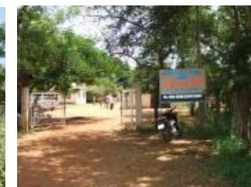
Centre de Recherche en Santé de Navrongo, Ghana