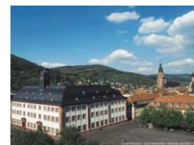
Université de Heidelberg, Allemagne

Département de Médecine Tropicale et de Santé Publique Département de Médecine Interne VI www.klinikum.uni-heidelberg.de