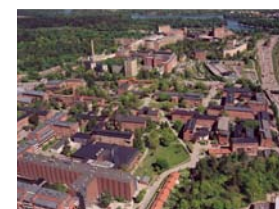
Institut de Karolinska, Suede