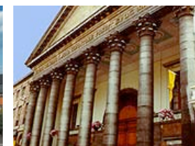
Université de Gent, Belgique