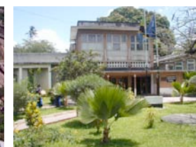
Université des Sciences de la Santé de Mubimbili, Tanzanie