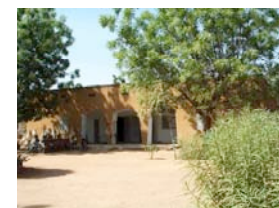
Centre de Recherche en Santé de Nouna, Burkina Faso