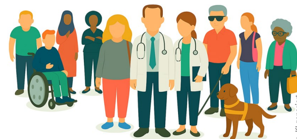
Abb. KI generiert