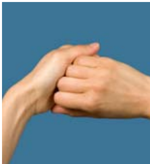
4. Außenseite der Finger auf gegenüberliegende Handflächen