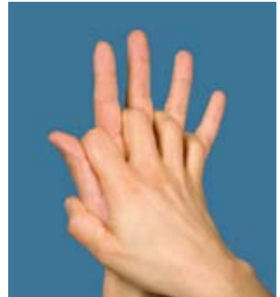
3. Handfläche auf Handfläche mit verschränkten Fingern