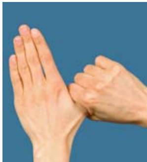
5. Kreisendes Reiben des rechten Daumens in der linken Handfläche und umgekehrt