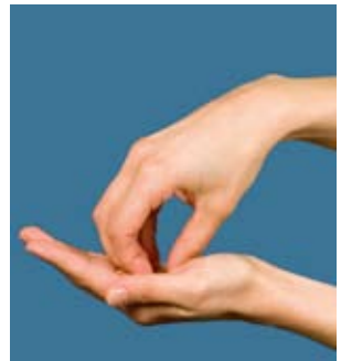
6. Kreisendes Reiben der Fingerkuppen der rechten Hand in der linken Handfläche und umgekehrt