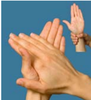
1. Handfläche auf Handfläche, inklusive Handgelenk