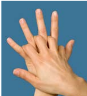
2. Rechte Handfläche über linkem Handrücken und umgekehrt