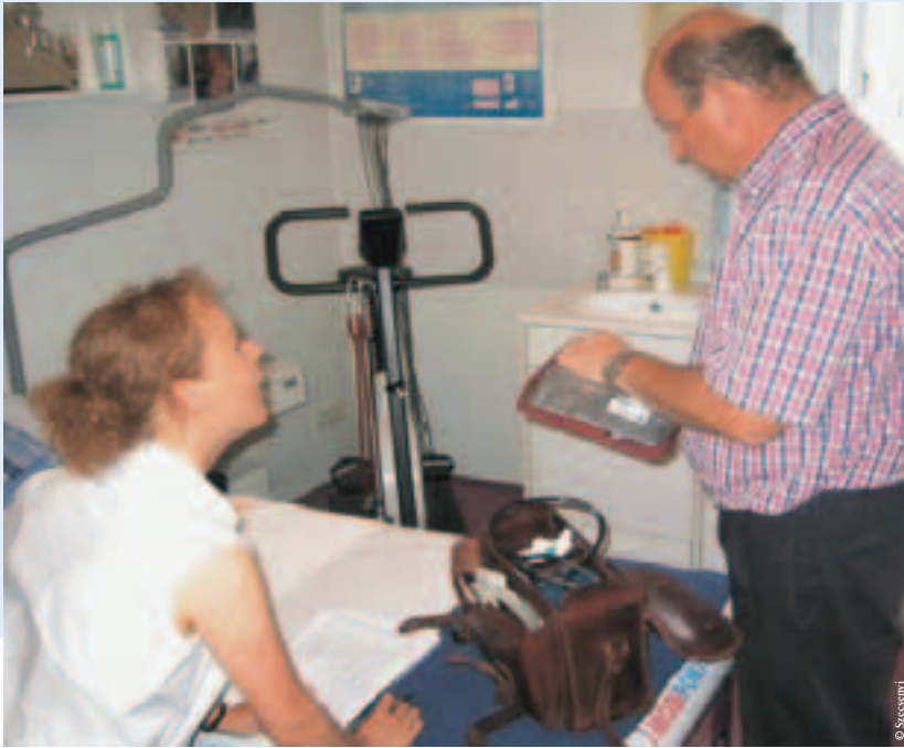
Kontrolle der Arzttasche zusammen mit dem Hausarzt ist eine der Aufgaben der Visitorin

Wie ist EPA aufgebaut? Man unterscheidet bei EPA zunächst 5 große Themenbereiche (Domänen) der Qualität: Infrastruktur, Menschen, Informationen, Finanzen sowie Qualität und Sicherheit (Abb. 1). Innerhalb der Domänen gibt es insgesamt 26 Unterthemen, sog. Dimensionen. Diese werden durch 168 Indikatoren gebildet. Hinter den Indikatoren stehen insgesamt 413 Fragen oder Informationen, mit denen eine Standortbestimmung erfolgt und eine Entwicklungsperspektive aufgezeigt wird. Dieser umfangreiche Katalog ist trotzdem sehr leicht umsetzbar und wenig aufwendig für die Praxis, da sich die Erhebung auf verschiedene Personen, Instrumente und Zeitpunkte verteilt (Praxisinhaber, Visitor, Mitarbeiter, Patienten).