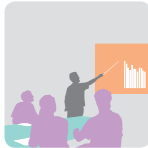
Workshop – Fallberichte