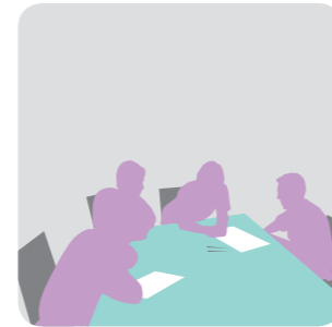
Workshop – Diskussion in Kleingruppen