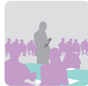
Plenarvortrag und Q&A