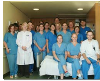
Mitarbeiter der Stroke Unit