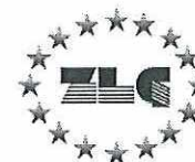
MEDCERT Zertifizierungsstelle (Lorenz Runge)

Anerkannt durch/Recognized by Zentralstelle der Länder für Gesundheitsschutz bei Arzneimitteln und Medizinprodukten www.zlg.de ZLG-AZ-186.15.09