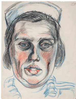
o. T. [Kopf einer Krankenschwester] untitled [head of a nurse], 1929 Inv. 8600/B 28 (2020)