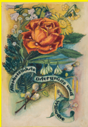
Letzte Postkarte an die Mutter „Allerherzlichste Ostergrüsse und Wünsche“ / last postcard to her mother: ‘Most heartfelt Easter greetings and wishes’, 5.3.1940 Wasserfarbe und Bleistift auf Karton / Watercolor and pencil on cardboard